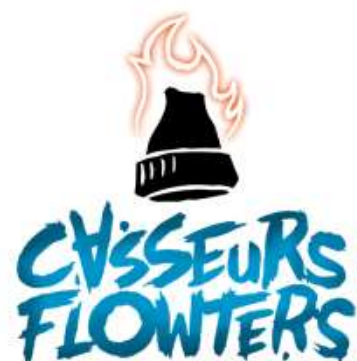
Photo d'Orelsan et du logo de son groupe

Casseurs Flowters est un groupe de hip-hop français. En 2000, la rencontre de Guillaume Tranchant (Gringe) et Orelsan à Caen, dans le Calvados, crée ce groupe. Grâce à des amis en commun, comme ils le racontent d'ailleurs dans leur chanson. Dans l'optique de progresser ensemble dans le rap, ils écrivent des textes et composent leurs chansons ensemble, sous les noms de Orel et Gringe. Ils publient en 2003 le premier projet, une mixtape : Fantasy : Épisode 1 ; leur premier véritable album viendra neuf années plus tard. Leur nom de groupe, inspiré du film Maman, j'ai raté l'avion apparaîtra peu de temps après.