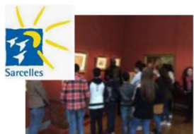
1 PE à Sarcelles (93)