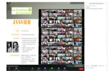
EE Live Ateliers numériques