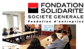
1 PE à Saint Priest (69)