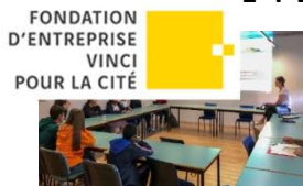
1 PE à Toulouse (31)