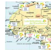
EE Afrique Francophone