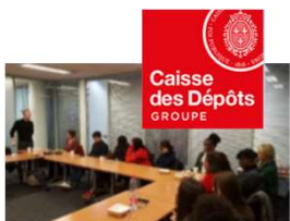
3 PE à Montreuil (93)