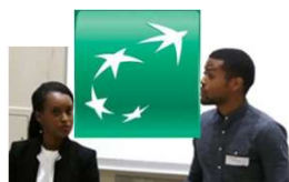
1 PE à Levallois (92)