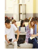
Les Promotions de l'Excellence