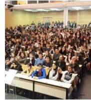
La Tournée de l'Excellence