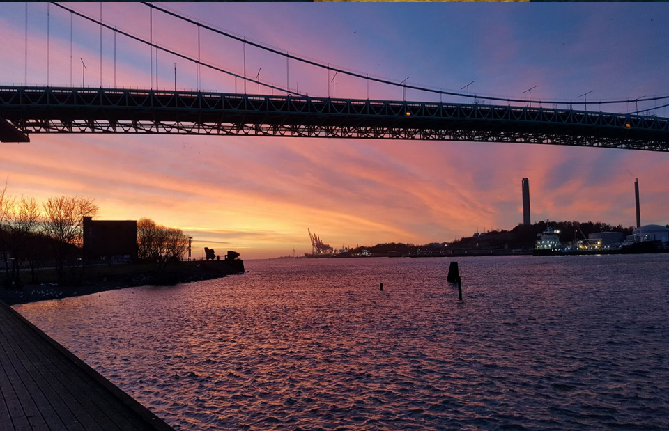
Photo de Göteborg groupe 2016-2017